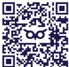
График ближайших эфиров