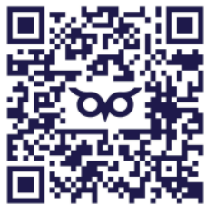
График ближайших эфиров