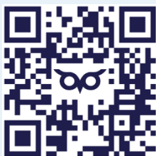
График ближайших эфиров